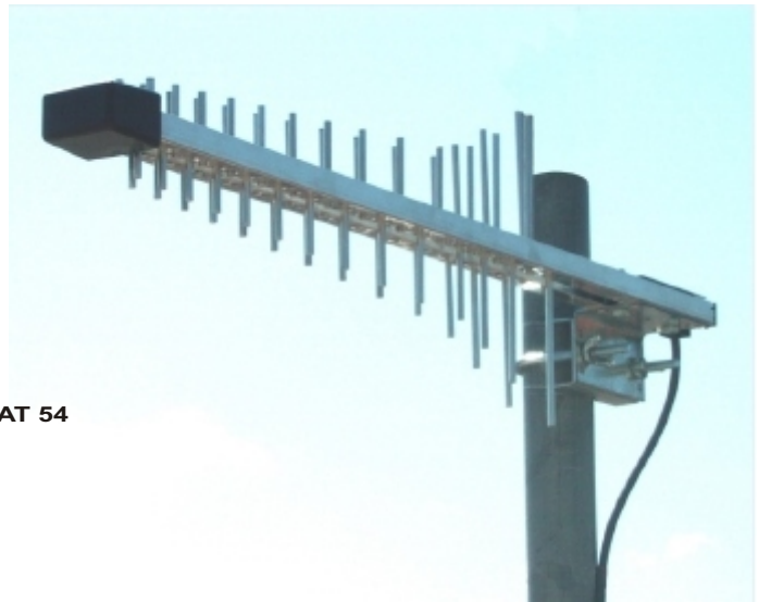
GSM/UMTS-Antenne LAT 54 Art.-Nr.768094